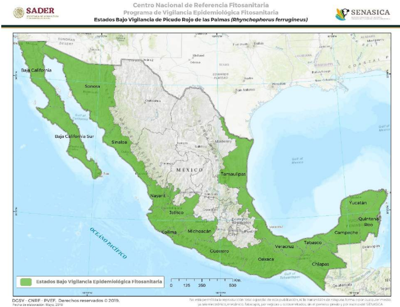
Figura 2. Vigilancia Epidemiológica Fitosanitaria para Rhynchophorus ferrugineus . Elaboración propia con datos de SADER-SENASICA-PVEF, 2019b.

de trapeo conformadas por 1,275 trampas ubicadas en sitios de riesgo de entrada y zonas potenciales de riesgo para el establecimiento de la plaga, la programación de revisiones de dichas trampas es de 54, 895 ocasiones (SADER-SENASICA-PVEF, 2019a), para la vigilancia de R. ferrugineus es en los siguientes estados de la Republica: Baja California, Baja California Sur, Campeche, Colima, Chiapas, Guerrero, Jalisco, Michoacán, Nayarit, Oaxaca, Quintana Roo, Sinaloa, Sonora, Tabasco, Tamaulipas, Veracruz y Yucatán (Figura 2) [SADER-SENASICA-PVEF, 2019b].